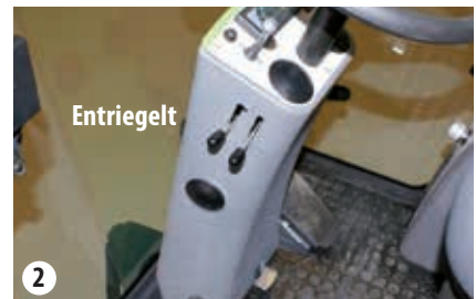
Transportverriegelung - entriegelt