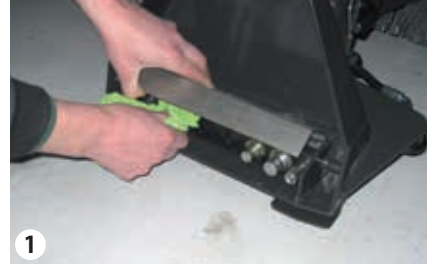
1 Die Kupplungen mit einem Tuch reinigen

Die Klappen über den Schnellkupplungen öffnen. Bereich um die Schnellkupplungen mit Druckluft reinigen. Die Kupplungen eventuell mit einem Tuch trocknen. Die Kupplungen, Anschlüsse usw. müssen vor Anbau des Geräts intakt sein. (Abb. 1)