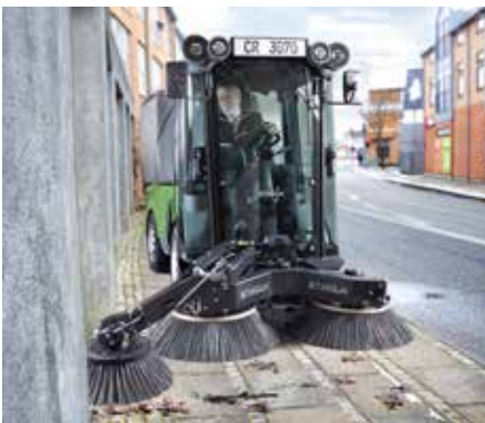
Kehmaschine mit 3. Besen