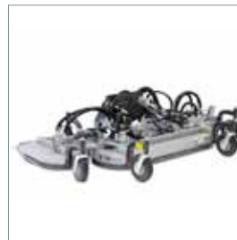
■ Triplex Heckauswurf- mäherwerk 2500