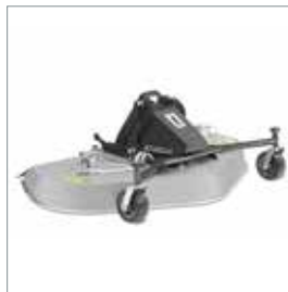
■ Heckauswurf-/ Mulchmäherwerk 1500