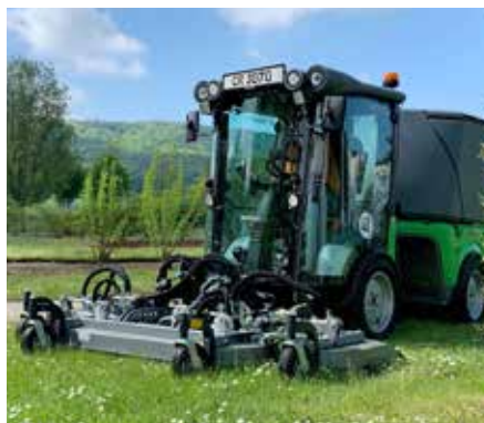
Triplex Heckauswurfmäherwerk 2500