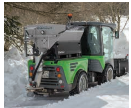
Salz- und Kiesstreuer