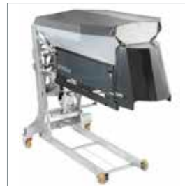
□ Salz- und Kiesstreuer