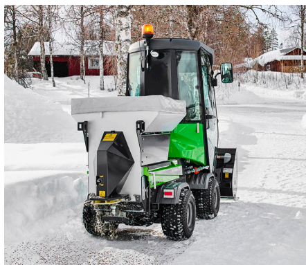
Salz- und Kiesstreuer