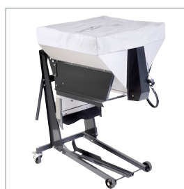
□ Salz- und Kiesstreuer