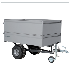
■ Leichter Kippwagen