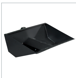
■ Kippbare Schaufel