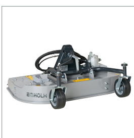
■ Heckauswurf-, Mulch- oder Grasaufnahmehäckerwerk 1000