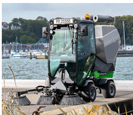
Kehrmaschine mit 3. Besen