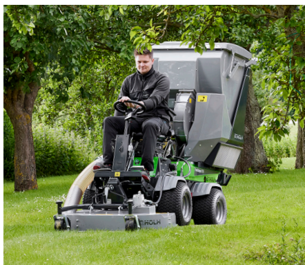
Heckauswurf-/Mulchmäherwerk 1000 mit Mähsaugcontainer