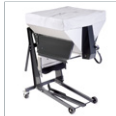
Salz- und Kiesstreuer