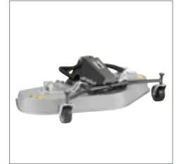
Heckauswurf-/ Mulchmähwerk 1500