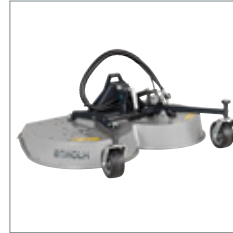
Heckauswurf-/ Mulchmähwerk 1200