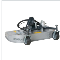
Heckauswurf-, Mulch- oder Grasaufnahmemähwerk 1000